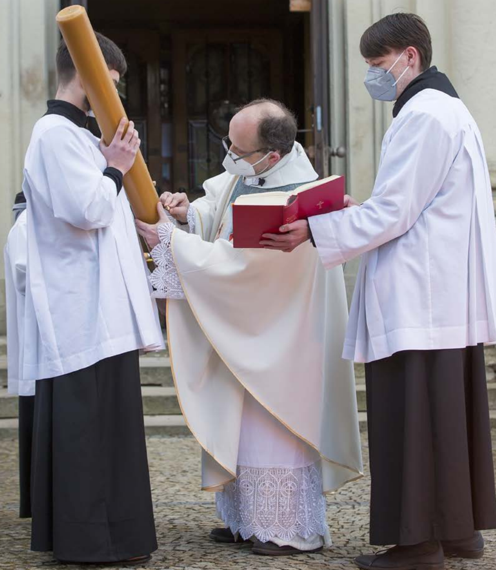
Vigilie v Mariánských Lázních.