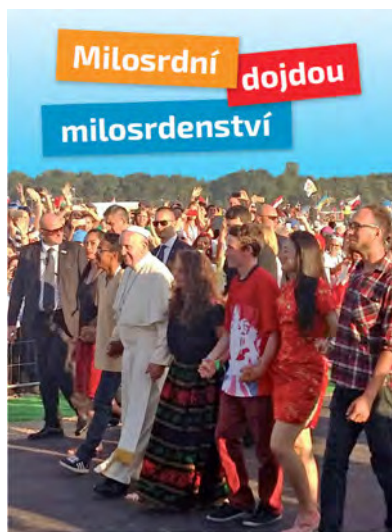
Světový den mládeže Krakov 2016

Kniha je k zakoupení v knihkupectví Paulínky a na DCM.