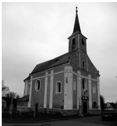
32 Milavče, kostel

V následujících měsících si projdeme kostely naší diecéze zasvěcené našemu světcí sv. Vojtěchovi. Je to světec, který je uznáván nejen našimi středoevropskými národy, Čechy, Slováky, Poláky a Maďary. Každý tento národ jej považuje „za svého“. Jeho činnost překračovala hranice. Narodil se kolem roku 956 na Libici a jeho otcem byl kníže Slavník. Neobvykle kvalitního vzdělání se Vojtěchovi dostalo v Magdeburgu. Po smrti prvního pražského biskupa Dětmara se stal druhým pražským biskupem. Jeho snahy o očištění duchovního života od pohanských zvyků a vymýcení nešvarů, jako byl obchod s otroky a mnoho-