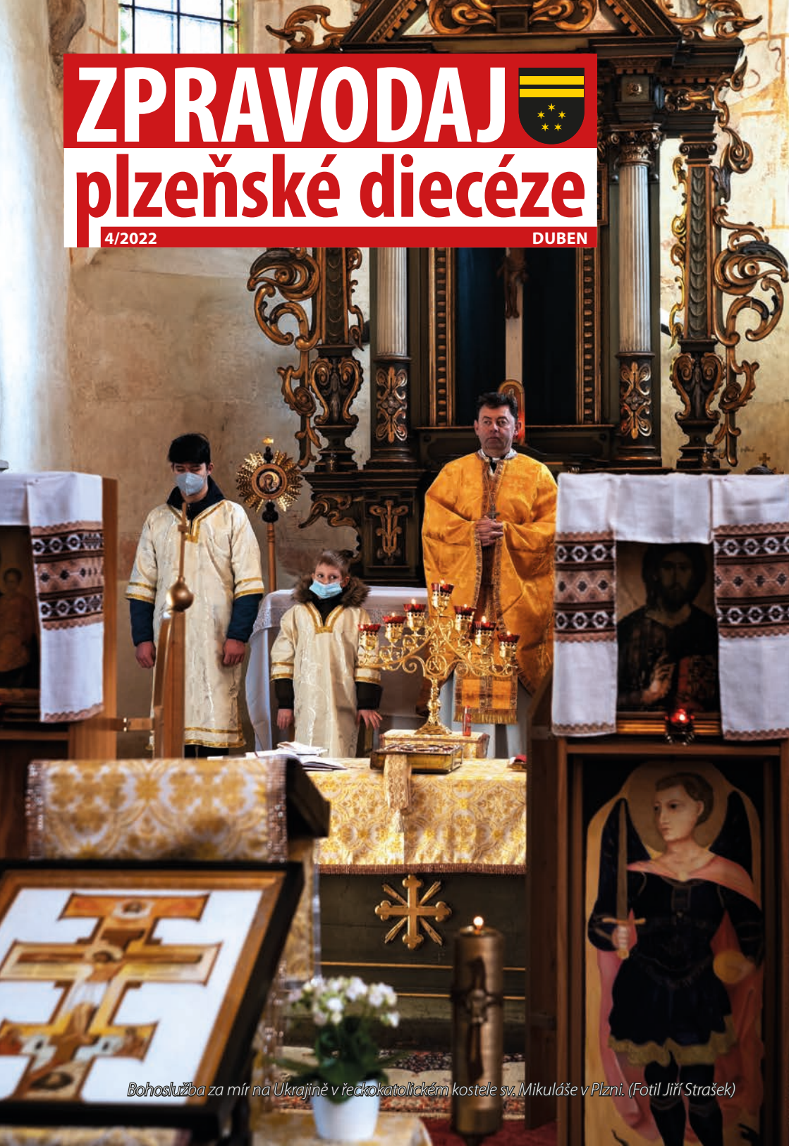
Bohoslužba za mír na Ukrajině v řeckokatolickém kostele sv. Mikuláše v Plzni.