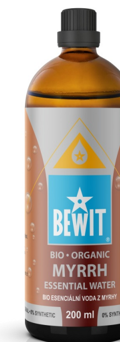
BIO ESENCIÁLNÍ VODA Z MYRHY

Myrha může pomoci i při snížené funkci štítné žlázy podle ajurvedy a čínské tradiční medicíny. Určité součásti v myrze mohou stimulovat její funkci. Denně můžete aplikovat přímo na oblast štítné žlázy dvě až tři kapky oleje.