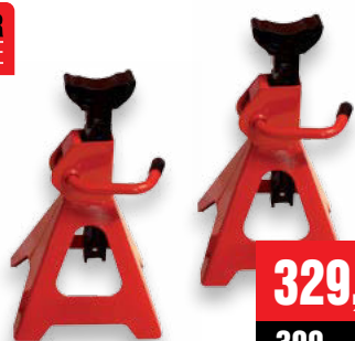
PODPĚRY nosnost 2 t, 2 ks (DO CF12466) • k zajištění stability vozidla zdvíženého heverem • rozsah 275 až 420 mm