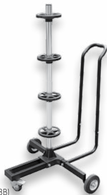
STOJAN NA PNEU pojízdný (DO CFRC2828B) • pro 4 ks pneumatik do šíře 225 mm a průměru 17" • nosnost: 100 kg