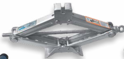
nůžkový 1 500kg (DO CF12473)