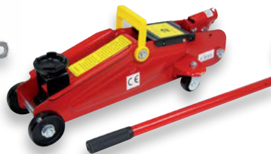
pojízdňý 2t (DO CF10253)