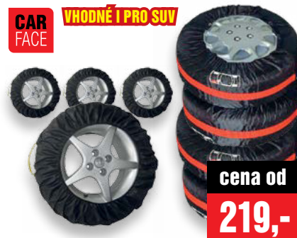
NÁVLEKY NA PNEU • 13" až 16" pneu, cena 219,- (DO CFAT34003) • 17" až 19" (i pro SUV) pneu, cena 409,- (DO VELO199) • sada 4ks, popruh pro přenášení