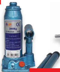
HEVERY hydraulický 2t (DO CF14801)