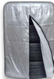
OBAL NA PNEUMATIKY (DO CFAT104009) • určeno pro skladování 13-16" pneumatik • materiál: 100% polyester • rozměr: výška 96 cm, průměr 66 cm