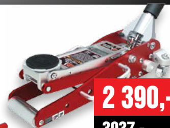
PROFI MOBILNÍ ZVĚDÁK, 1,3 t hliníkový, nízkoprofilový (GV T815012I)