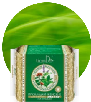
Denné menštruačné vložky kód 61912

25 ks intímnych/slipových vložiek na denné nosenie v balení