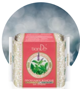
Denné vložky s aniónmi kód 61915

20 ks intímnych/slipových vložiek na denné nosenie v balení