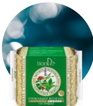
Nočné menštruačné vložky kód 61913

10 ks menštruačných vložiek na noc alebo počas prvých dní silnej menštruácie