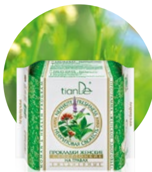
Tenké slipové vložky kód 61921

20 ks intímnych/slipových vložiek na denné nosenie v balení