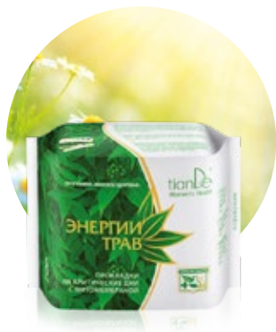
Denné menštruačné vložky kód 61902

20 ks intímnych/slipových vložiek na denné nosenie v balení