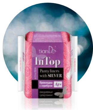
In top Slipové vložky so striebrom, supertenké kód 65512

Slipové vložky so striebrom, supertenké vďaka obsahu koloidného striebra pôsobia preventívne proti infekciám, baktériám a eliminujú nepríjemný zápach. Dámske bylinné nočné vložky max ocenia ženy s veľmi silným priebehom menštruácie a tiež ženy počas menopauzy, ktoré trápí jeden z jej prejavov – inkontinencia.