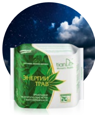
Nočné menštruačné vložky kód 61903