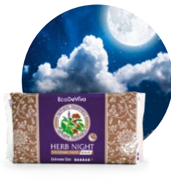
Dámske bylinné nočné vložky max kód 681922

20 ks intímnych/slipových vložiek na denné nosenie v balení