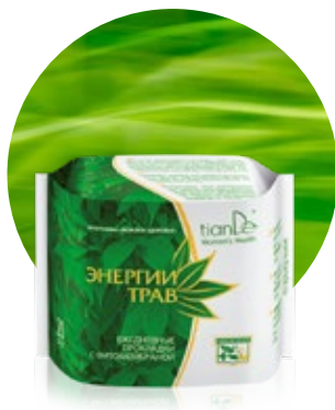
Denné slipové vložky kód 61901

Línia Energia bylín obsahuje nasledovné produkty.