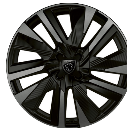
Hliníkové kolo EVISSA 18" černé s výbrusem a černými doplňky ZHKP