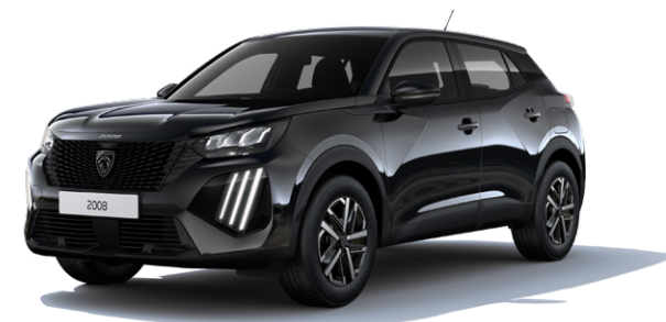
Černá PERLA NERA M09V