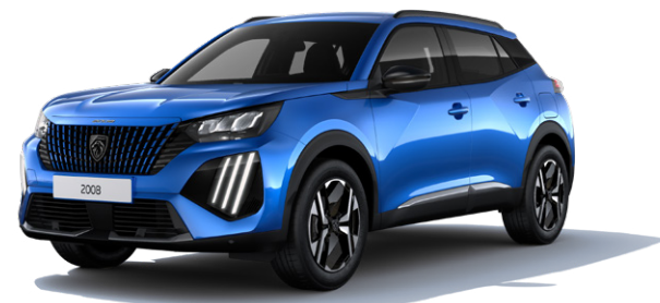
Modrá VERTIGO M6SM