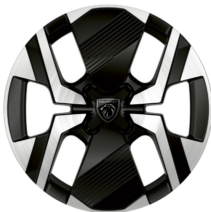
Hliníkové kolo KARAKOY 17" černé s výbrusem ZHL1