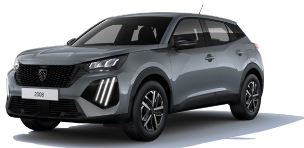
Šedá SELENIUM MOLD