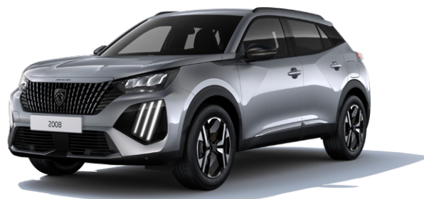
Šedá ARTENSE MOF4