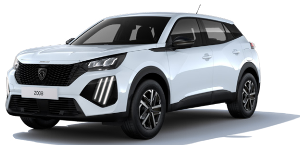
Bílá OKÉNITE MOSU