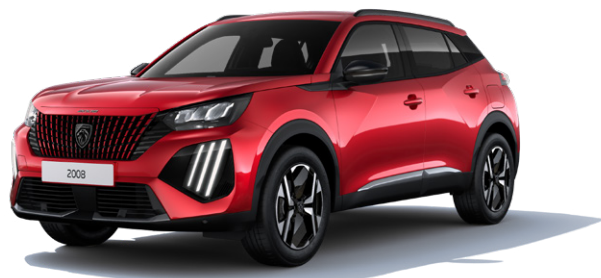
Červená ELIXIR M5VH