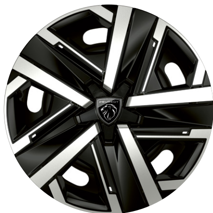
Okrasný kryt SILOM 16" ZHK6