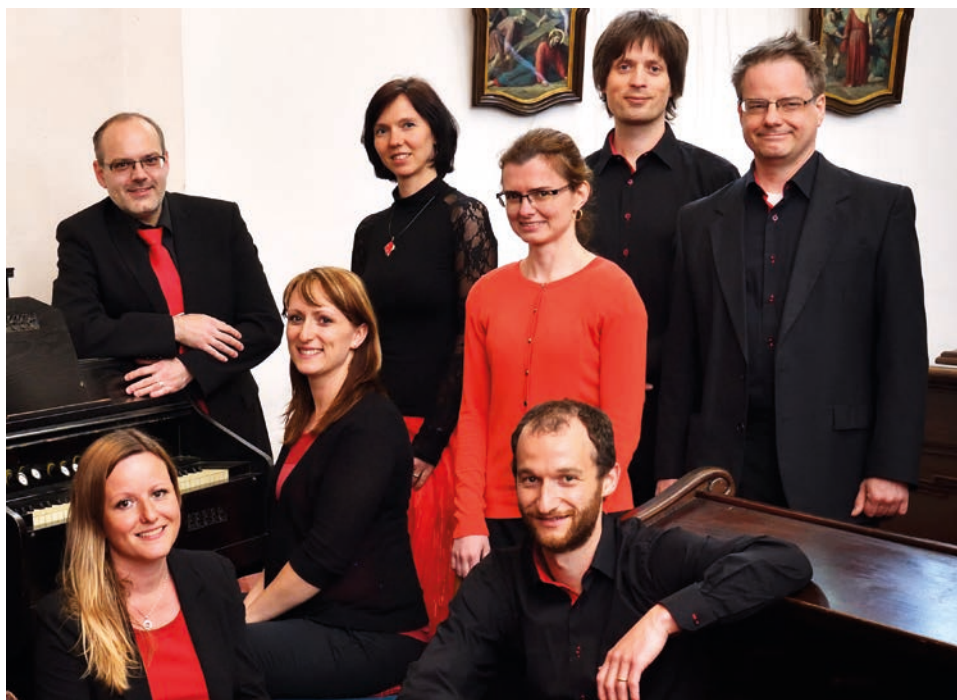
Poutní mše v Oseku, srpen 2018

Ano, máme již připravený program, který postupně nacvičujeme a se kterým budeme vystupovat. Připravujeme také koncerty, některé