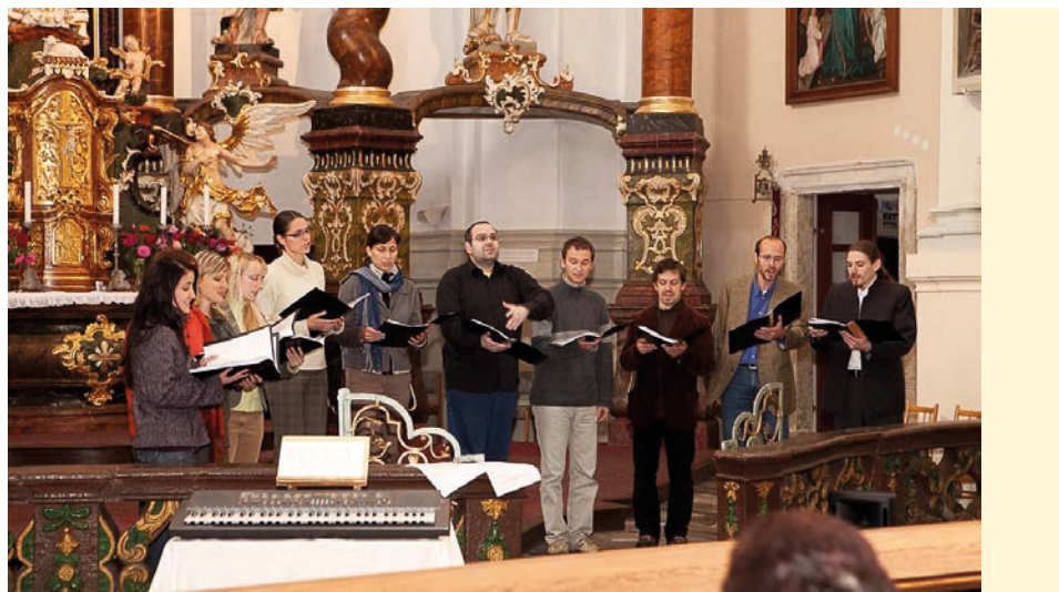
Setkání schol v Boru, říjen 2009

Sbormistrem jsem se stal v roce 2000. V té době se dirigování a vedení nového sboru nechťel nikdo ujmout, a tak jsem to vzal. Vytvořili jsme v Plzni Scholu studentského klubu vysokoškoláků a pravidelně doprovázeli středeční studentské mše. Bylo štěstí, že se nás tehdy sešlo více, kteří měli touhu zpívat sborově. Postupem času se začali přidávat i další vysokoškoláci s různými zaměřenými (studující obory humanitní, technické či medicínu) – to bylo hodně inspirativní a obohacující, vytvořilo se nám krásné společenství. Často jsem měl pocit, že dostávám zpět víc, než dávám, a to mě pohánělo dál. V roce 2006, kdy již všichni členové dostudovali, jsme předali zpívání na studentských mších další generaci. Rozhodli jsme se, že budeme ve zpívání pokračovat. Přejmenovali jsme se na Vox Imperfecta