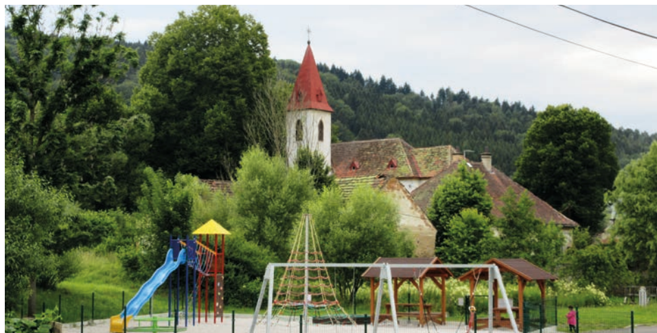
Kostel Povýšení sv. Kříže, Chlistov

V Tržku, malebné osadě těsně na hraně kolínské pánve, odbočíme u rybníčku za křížkem po neznačené lesní cestě. Ocitneme se na vrstevnici velmi prudkého svahu, jež nás odmění mimořádnými výhledy do kraje. Dříve tu stál odpudivý ponurý smrkový les, kde i ptáci pípali toliko úzkostí, ale díky kůrovci, nejlepšímu příteli turistů, procházíme kvetoucí pasekou plnou malin a bzučícího hmyzu. Ukazuje se, že kůrvec zvýšil produkci šumavského medu a významně pomohl biodiverzitě. Lesákům se tímto omlouvám za hloupé řeči. Cesta nás vede kolem vesnického hřbitůvku do Chlistova , cíle naší cesty. Pokud jste o téhle obci neslyšeli, o hodně přicházíte! Na návršíčku se vypíná malebný gotický kostelík Povýšení sv. Kříže , do jehož západní zdi jsou vsazeny dva jemné mramorové náhrobky z minulých století a na východní straně u schodiště nad silničkou stojí opravená polychromovaná socha sv. Jana Nepomuckého, který ostřížím zrakem sleduje řidiče, zda do zatáčky vjíždějí přiměřenou rychlostí. U cesty je k vidění i několik památkově chráněných šumavských roubenek. Děcka ale nejvíce ocení