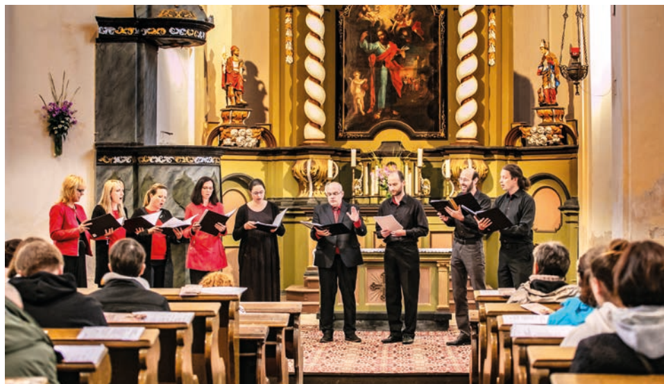
Festival Šumava na Prusinách, 27. 5. 2022

s benefičním přesahem. Účast na letošním Setkání sborů ještě není jistá, ale snad to vyjde. V Klatovech, kde se letos v říjnu setkání koná, jsou čerstvě zrekonstruované kostely, takže se tam bude zpívat v nádherném prostředí.