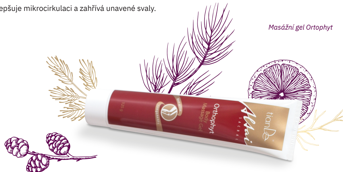
Masážní gel Ortophyt

Máte z toho všeho ohýbání a natahování unavené tělo? Nedejte ztuhlým svalům a nepříjemným bolestem v zádech šanci. Masážní gel Ortophyt zlepšuje mikrocirkulaci a zahřívá unavené svaly.