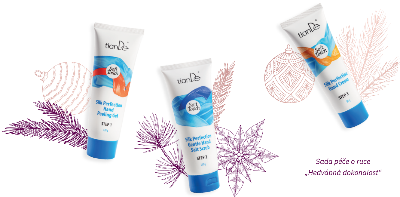
Sada péče o ruce „Hedvábná dokonalost“

Veškerý úklid velmi namáhá pokožku vašich rukou. Řiďte se heslem vždy připraven a nezapomeňte na správnou péči. Se sadou Hedvábná dokonalost vám vaše ruce poděkují.