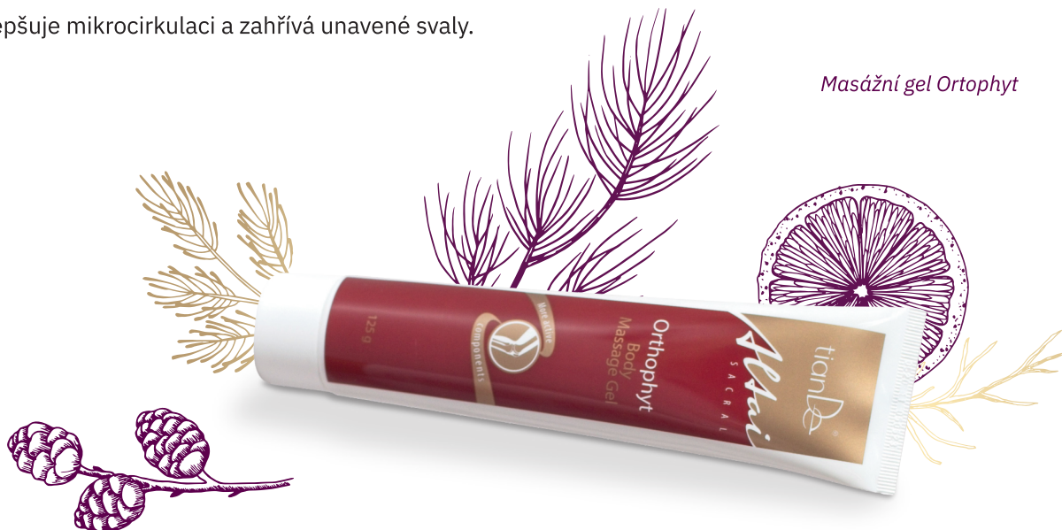
Masážní gel Ortophyt

Máte z toho všeho ohýbání a natahování unavené tělo? Nedejte ztuhlým svalům a nepříjemným bolestem v zádech šanci. Masážní gel Ortophyt zlepšuje mikrocirkulaci a zahřívá unavené svaly.