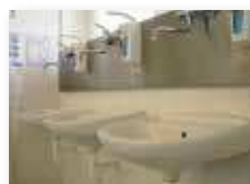
vodovodní baterie a odpady