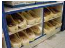
botníky a obuv