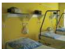
JIP a pooperační pokoje

Dezinfekční účinnost: BAKTERICIDNÍ včetně MRSA, FUNGICIDNÍ, široké spektrum VIRUCIDNÍ, MYKOBAKTERICIDNÍ a TUBERKULOCIDNÍ.