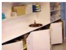
skříňky a zásuvky