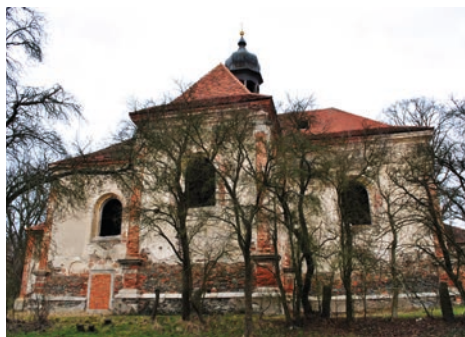
Kostel sv. Barbory

Sledujte napřed zelenou turistickou značku a pak pokračujte dolů po polní cestě do zapadlé vísky Čečovice. Uprostřed obce svítí věž kostela sv. Mikuláše a – je to možné? K ní se přimyká cihlová gotická loď jako přenesená odněkud z dalekých zemí. Člověk by tu čekal klasické