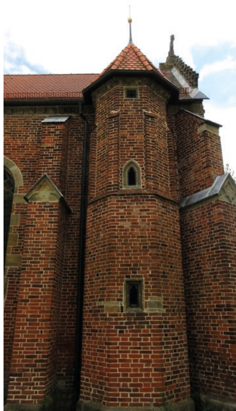
Kostel sv. Mikuláše