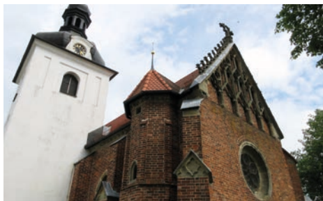
Kostel sv. Mikuláše

vesnické baroko a ne že se ocitne tváří v tvář stavbě jak z německé učebnice středověku. Díváme se na jednu z nejvýznamnějších (a také nejméně známých) gotických pamětihodností západních Čech, která byla po právu vyhlášena národní kulturní památkou. Stavěla ji zejména řezenská stavební huť, která vybudovala tamní katedrálu a naumburský chrám.