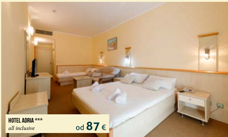
HOTEL ADRIA *** all inclusive