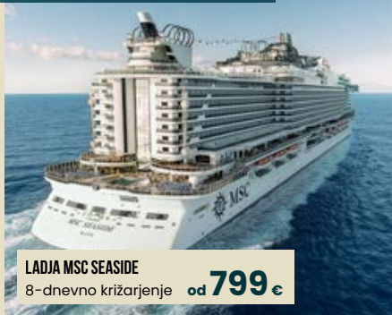
LADJA MSC SEASIDE 8-dnevno križarjenje od 799 €