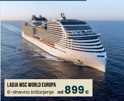
LADJA MSC WORLD EUROPA 8-dnevno križarjenje od 899 €