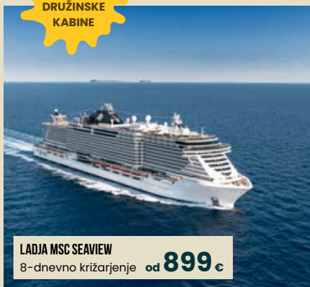
LADJA MSC SEAVIEW 8-dnevno križarjenje od 899 €