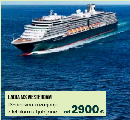
LADJA MS WESTERDAM 13-dnevno križarjenje z letalom iz Ljubljane od 2900 €