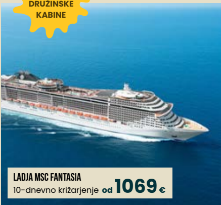
LADJA MSC FANTASIA 10-dnevno križarjenje od 1069 €