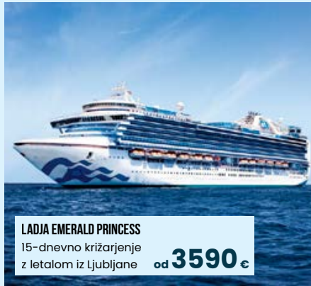
LADJA EMERALD PRINCESS 15-dnevno križarjenje z letalom iz Ljubljane od 3590 €