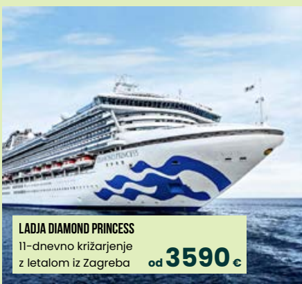
LADJA DIAMOND PRINCESS 11-dnevno križarjenje z letalom iz Zagreba od 3590 €