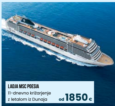
LADJA MSC POESIA 11-dnevno križarjenje z letalom iz Dunaja od 1850 €