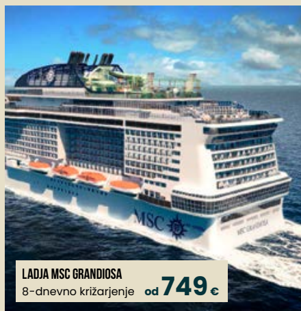
LADJA MSC GRANDIOSA 8-dnevno križarjenje od 749 €