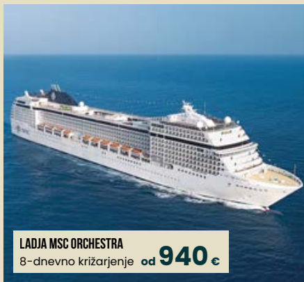
LADJA MSC ORCHESTRA 8-dnevno križarjenje od 940 €