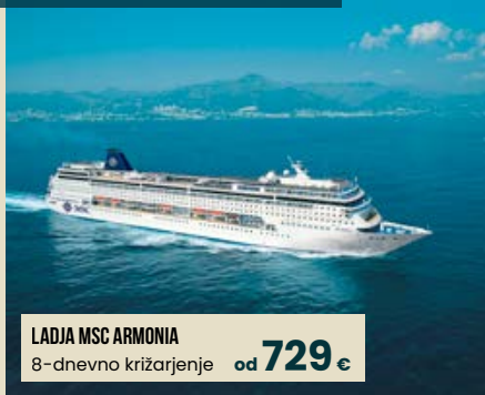
LADJA MSC ARMONIA 8-dnevno križarjenje od 729 €