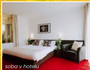
soba v hotelu