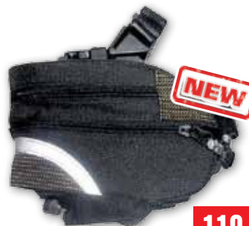
PODSEDLOVÁ BRAŠNA NA KOLO

upevnění klik-fix, objem 0,65 l (DO BV180665P)