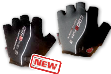
RUKAVICE NA KOLO CODA FLEX

černé (DO BV1021XXS až DO BV1021XXL) šedočerné (DO BV1022XXS až DO BV1022XXL) • velikosti XS až XXL