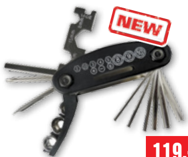
SADA NÁŘADÍ NA KOLO