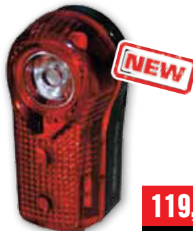
ZADNÍ SVĚTLO NA KOLO