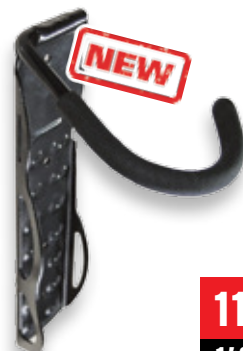
DRŽÁK NA JÍZDNÍ KOLO