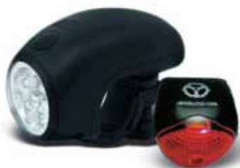
SADA SVĚTEL NA KOLO