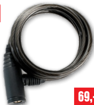
ZÁMEK NA KOLO

8 mm x 1,2 m (DO CFAT83038) • včetně držáku