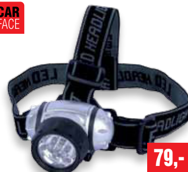
ČELOVÁ SVÍTLILNA 7x LED