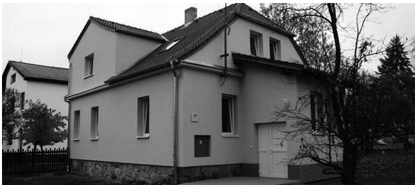
Komunitní centrum Horšovský Týn