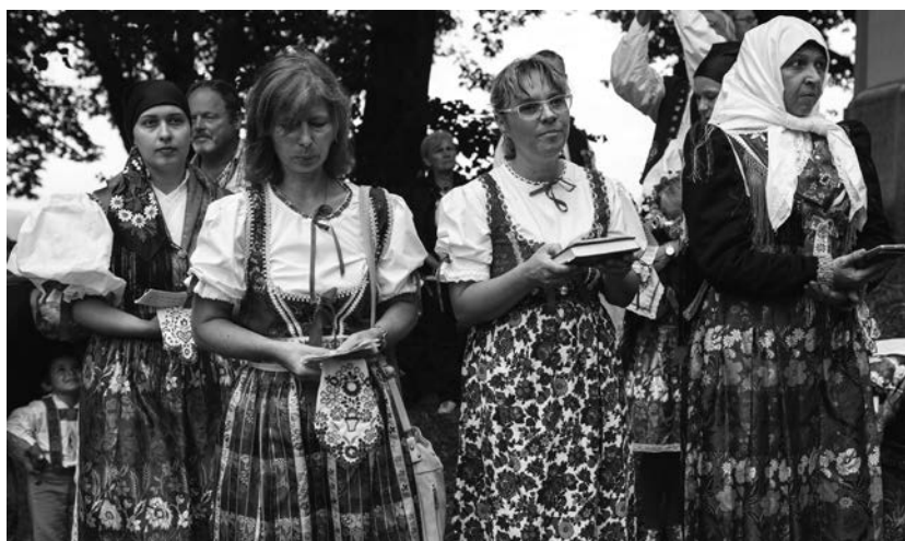
(text redakční,)