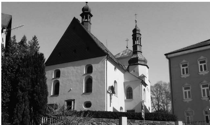
Luby u Chebu