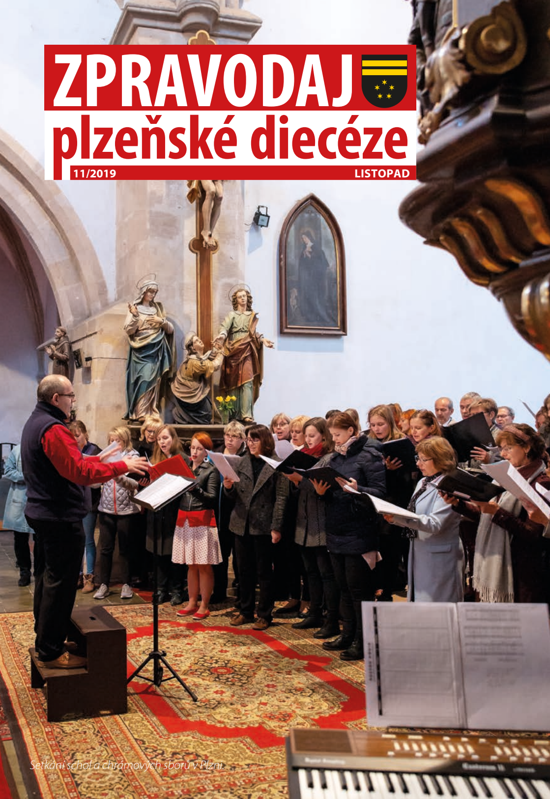
Setkání škol a chrámových sborů v Plzni.